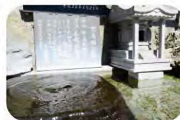
《採水地》 女鳥羽の泉(善哉酒造)

松本市内の湧き水「女鳥羽の泉」を使用した二つの商品「松本サイダー」と「城下町の湧き水」。どちらの商品も売れ行き好調で、この夏おすすめしたいイチオシ商品です。お土産としてもお使い頂けます。