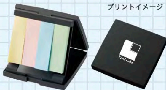
プリントイメージ